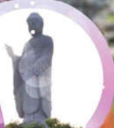
อุซึคุ โดบุสึ